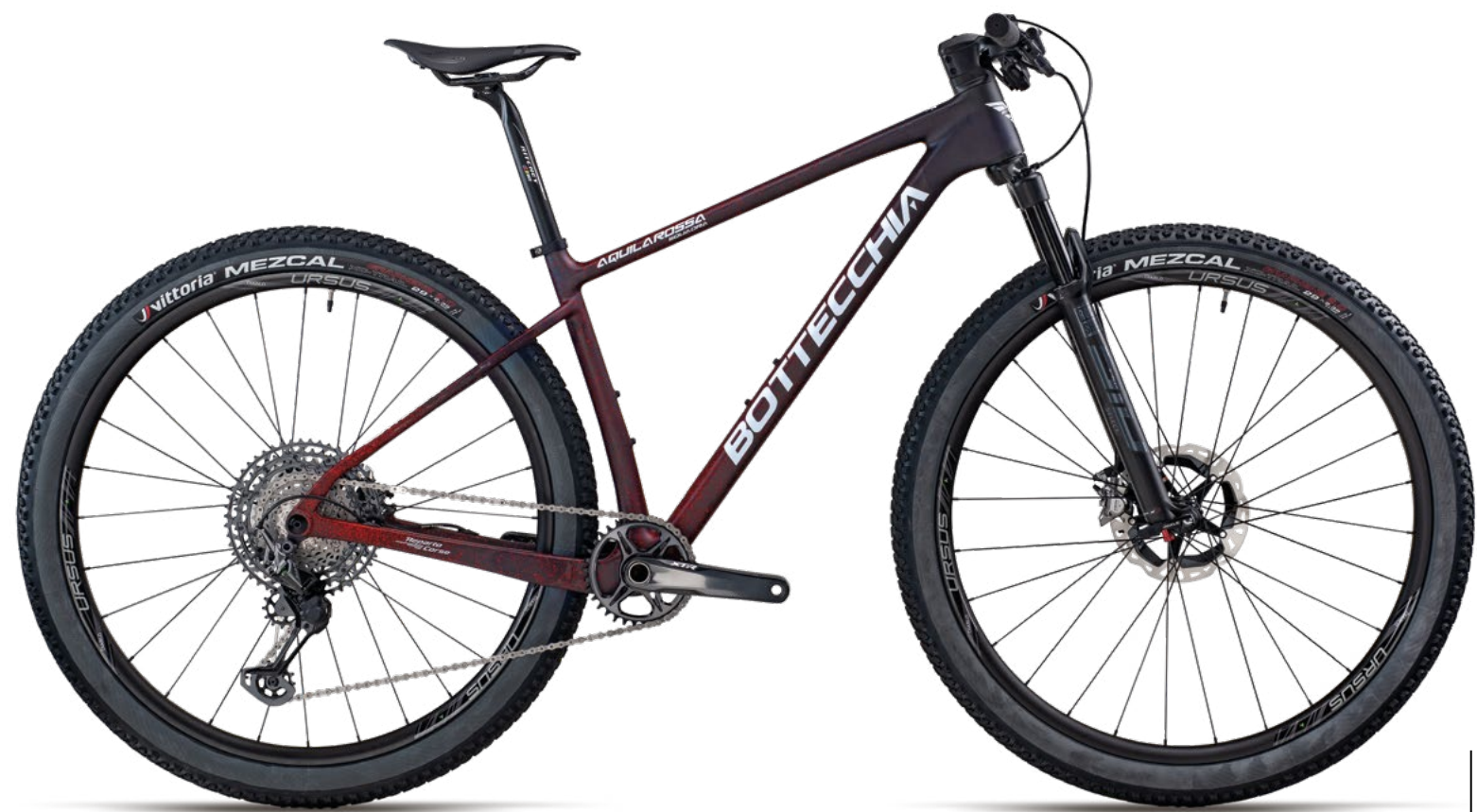
AQUILA ROSSA SQUARDA official bike of the Bottecchia Factory Team.

C7 Nero Opaco Verde Oro Lucido C7 Matt Black Glossy Green Gold