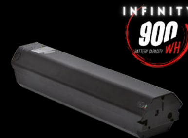
BATTERIA 900 / BATTERY 900