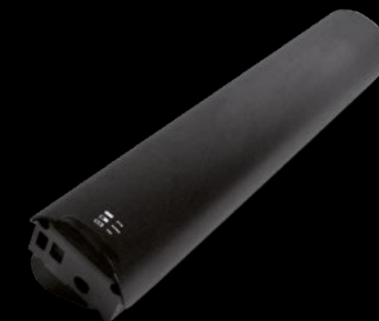
BATTERIA 504 / BATTERY 504