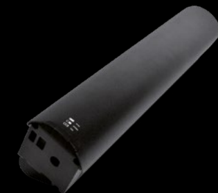
BATTERIA 630 / BATTERY 630