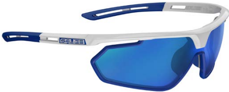
BIANCO • RW BLU WHITE • RW BLUE