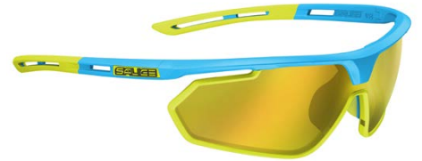
TURCHESE • RW GIALLO TURQUOISE • RW YELLOW