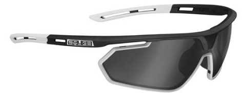
NERO • RW NERO BLACK • RW BLACK