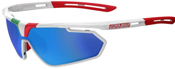
BIANCO • RW BLU WHITE • RW BLUE