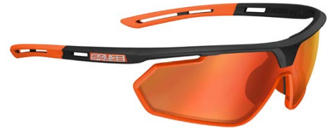
NERO-ARANCIO • RW ROSSO BLACK-ORANGE • RW RED