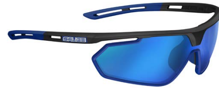
NERO • RW BLU BLACK • RW BLUE