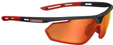
NERO-ROSSO • RW ROSSO BLACK-RED • RW RED