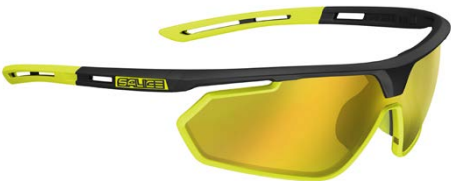
NERO • RW GIALLO BLACK • RW YELLOW