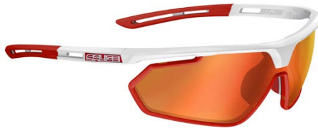
BIANCO • RW ROSSO WHITE • RW RED