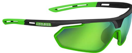
NERO • RW VERDE BLACK • RW GREEN