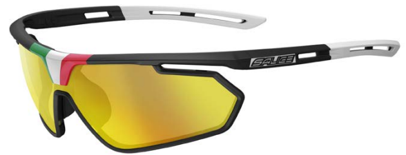
NERO • RW GIALLO BLACK • RW YELLOW